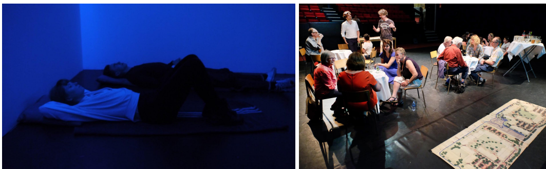
Links: proeve van ‘Het gewicht van een gedachte’ en rechts ‘De Nieuwe Banne 2, pioniers’, beiden in de Rietwijker