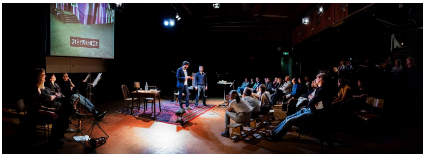
‘De wereld draait Noord’ in de theaterzaal van de Rietwijker