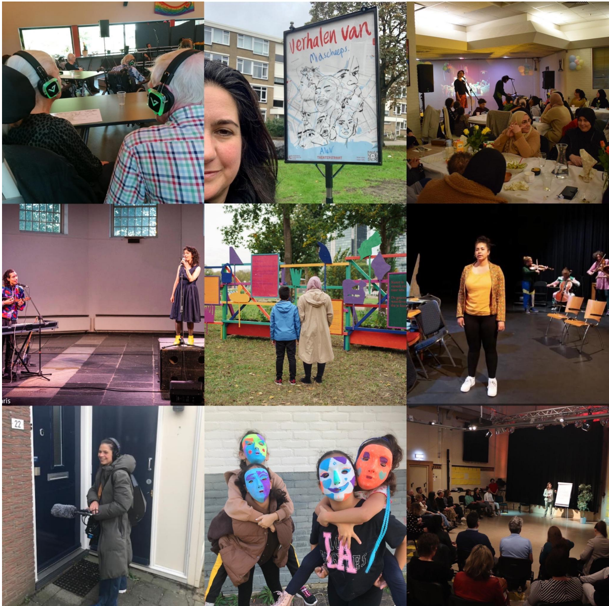
Afbeeldingen van verschillende projecten van de Theaterstraat uit 2022

In het jaar 2022 werd er verder gewerkt vanuit een meerjarig beleidsplan van sociaal-artistische projecten en ontwikkelingen binnen onze organisatie die in 2021 zijn ingezet. Dit beleidsplan bestaat uit een 2-jarig ontwikkelplan dat werd ondersteund door het AFK met een structurele subsidie ter ondersteuning van onze activiteiten en het verder ontwikkelen en professionaliseren van onze organisatie, met name op het gebied van marketing en zichtbaarheid.