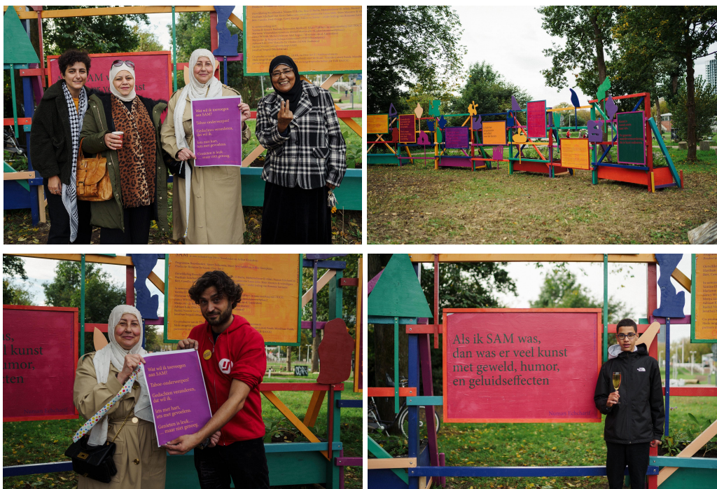
Opening SAM Poster Panorama, 23 oktober 2022