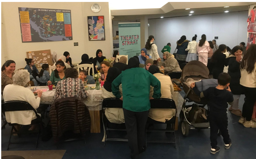
Moeders en dochters eten en gaan in gesprek in de Rietwijker

De waarden van de Theaterstraat draaien al langere tijd om duurzame en betrouwbare relaties creëren met onze omgeving, maar we waren op verschillende fronten als projectorganisatie ingericht. Nu werken we sinds september 2021 met ondersteuning van tweejarige subsidie van AFK aan een project-overstijgende organisatie die past bij onze waarden. Een belangrijke stap die wij voor ogen hebben voor de komende twee jaar is het groeien in de publiekswerking en -werking en de community-building. Wat we met deze ontwikkeling willen bereiken is o.a. het verdiepen, contextualiseren en wederkerig maken van (bestaande) publieksrelaties; en het leggen van relaties met de Theaterstraat als geheel i.p.v. met 1 maker of 1 project.