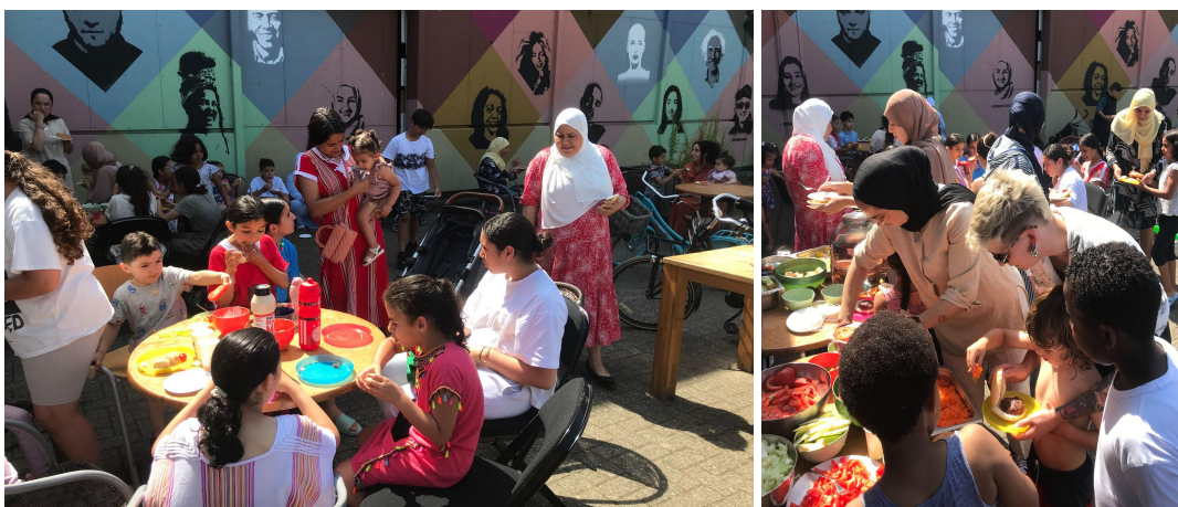
Afsluitende kookworkshop en bbq in/voor de Rietwijker.

Daarnaast hebben we in de periode 2021-2023 veel tijd gemaakt voor gesprekken over werkcultuur, de voor- en nadelen van onze platte organisatie, en hoe wat we voor elkaar kunnen doen om gezond en geïnspireerd te functioneren. Ook is er in 2023 een code Sociale Veiligheid opgesteld, en een vertrouwenspersoon aangesteld. Die informatie wordt met alle (gast)medewerkers gedeeld.