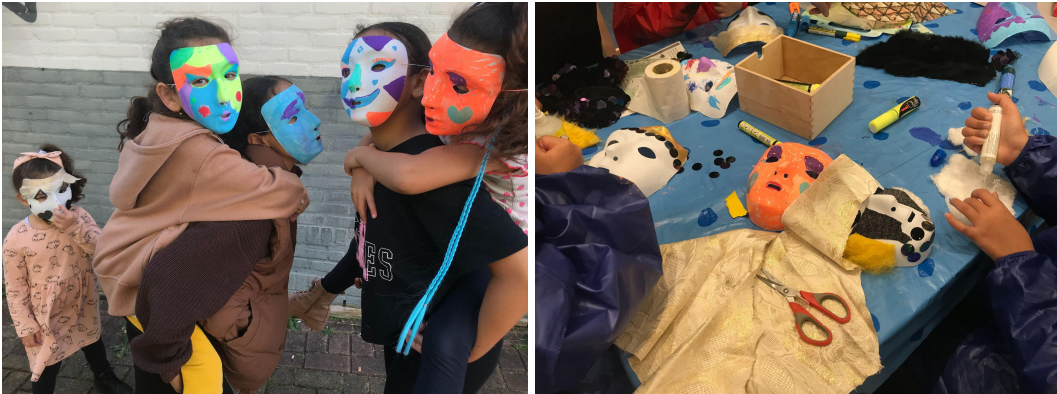
De workshop maskers maken met gekleurde patronen en stoffen